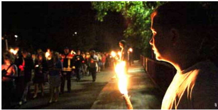
Lichterprozession zum Urheiligtum

tailbar und Schwabenzelt, Café-Jurte und mobilem Heiligtum treffen sich dort Baden, Bayern und all die anderen. Denn eins ist klar, wenn in Schönstatt gefeiert wird: Pray und Party schließen sich nicht aus. So wird manch einer noch spät bei einem nächtlichen Besuch im Urheiligtum gesichtet. Während in der Cocktailbar der erste Caipi über die Theke geht und eine Gruppe Trierer sich in der Ecke zu lustigen Kreisspielen formiert, stimmt man am Lagerfeuer voll Inbrunst die Schwabenhymne an.