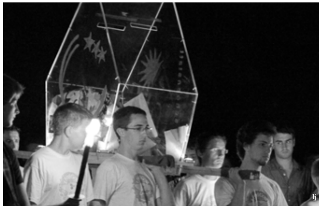
Fackelläufer und Heiligtumsträger führen die Prozession an

Straße und die Reinisch-Brücke. Bis hin zum „Autobahnkreuz Schönstatt“, der zweiten Stati-